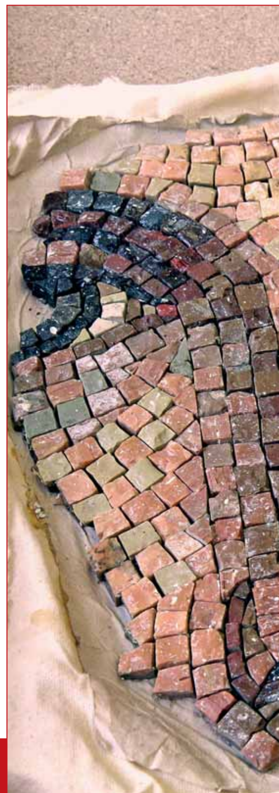
Fragment des Marien-Mosaiks im Marien-Dom zu Erfurt

Mit diesem Bild der Gottesmutter im Kopf bekommt die Weihnachtsgeschichte auch noch mal eine ganz