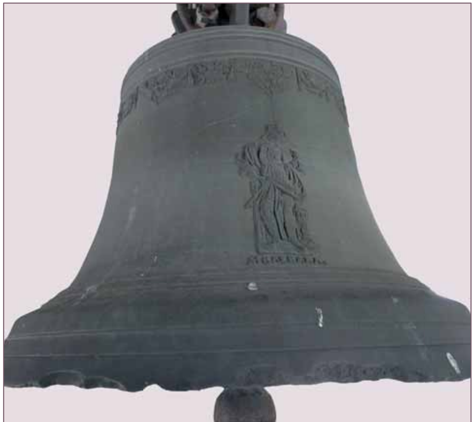
Möglingen, St. Maria Leihglocke aus dem Breslauer Dom von Joh. Sebastian Gerstner, Breslau 1770

Begegnungen, Einladungen zwischen den Beteiligten. Bischöfe, Jugendvertreter, Seelsorger aus den entsprechenden Gebieten wurden in unsere Diözese eingeladen. Es wurde gemeinsam gefeiert. Es gab Feste der Versöhnung.