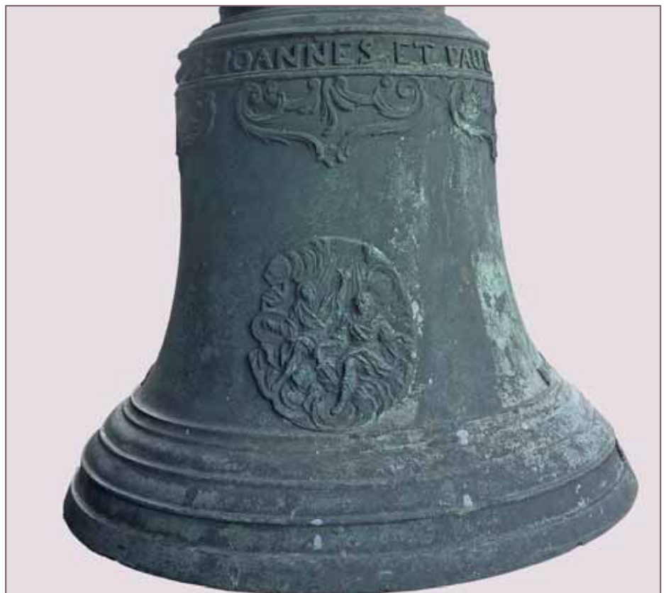
Hemmingen, St. Georg Leihglocke von Franz Stanke, Troppau 1779

Als vor zehn Jahren bei Renovierungsarbeiten im Rottenburger Dom eine polnische Glocke gefunden wurde, entstand das Projekt »Friedensglocken für Europa« von Bischof Fürst. Die geraubten Glocken sollten zurück in ihre Heimatkirchen gebracht werden, die Gemeinden erhalten neue Glocken.