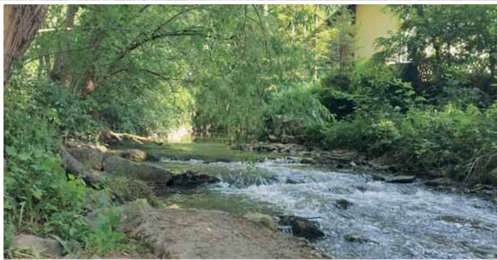
Wilde Glems bei Schwieberdingen