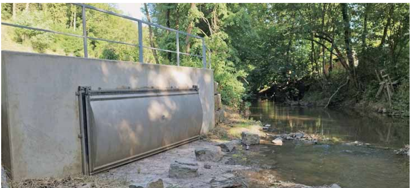
Verlängerter Staukanal schützt Schwieberdingen vor Hochwasser

Die Gemeinden haben viele Maßnahmen, die aus der Risikoanalyse