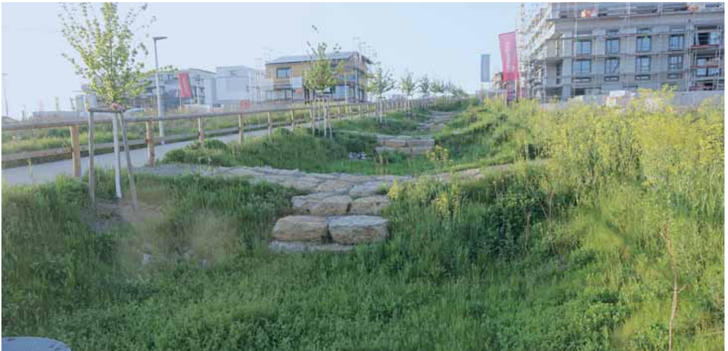
Kaskaden für das Regenwassermanagement und Retentionsbecken im Neubaugebiet »Korntal-West«

abgeleitet wurden, bereits umgesetzt. Zum Beispiel wurde in Schwieberdingen der Staukanal neu gebaut, um ein Überfluten der Altstadt zu verhindern. In Korntal-Münchingen wurden Regenüberlauf und -rückhaltebecken gebaut bzw. vergrößert. Außerdem wurden die acht Gemeinden an das Hochwasserkrisenmanagement System FLIWAS-3 (Flut-Informations- und Warnsystem) des Ministeriums für Umwelt Klima und Energiewirtschaft Baden-Württemberg angeschlossen.