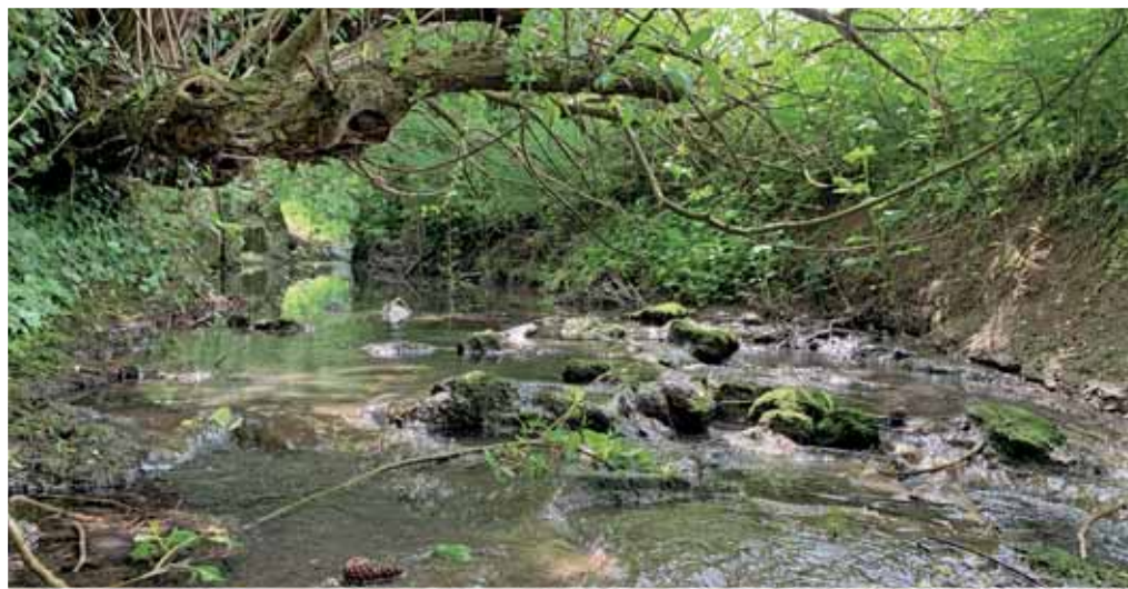
Leudelsbach bei Möglingen