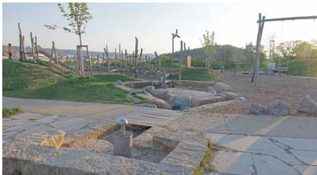
Wasserspielplatz in Korntal